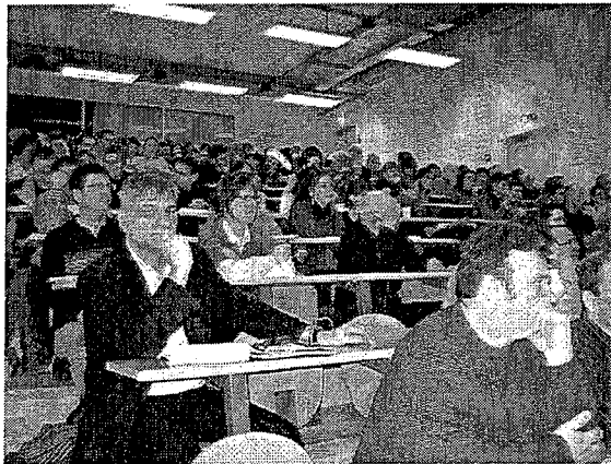
Une partie du public dans l'amphithéâtre Segalen

À la fin de l'année 2006, amenée à travailler sur la réforme de la formation d'éducateur spécialisé à l'ITES, je m'avisais qu'il y a maintenant quarante ans, le décret du 22 février 1967 instituait officiellement le Diplôme d'État d'éducateur spécialisé (DEES). Voilà donc plus de quarante années qu'un corps professionnel d'éducateurs spécialisés était officiellement constitué. Est née alors l'idée de prendre appui sur cet anniversaire à chiffre rond pour s'arrêter un moment sur cette profession et son évolution.