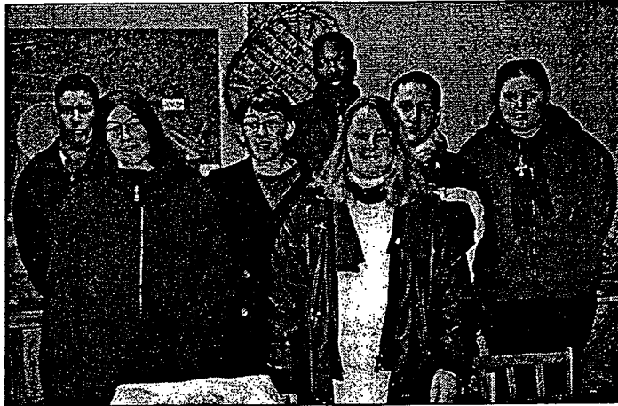
Une partie des dix jeunes qui vont partir pour une semaine à Dresde, du 2 au 8 décembre.