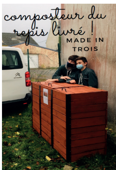
Composteurs Gestion des déchets