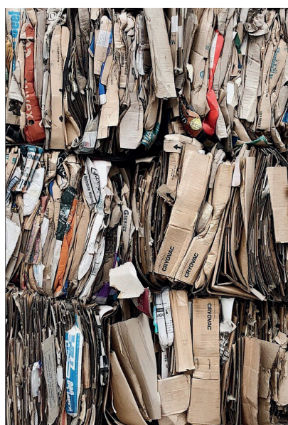
Recyclage du papier Gestion des déchets