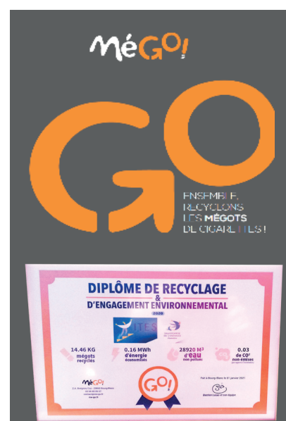
Recyclage des mégots Gestion des déchets